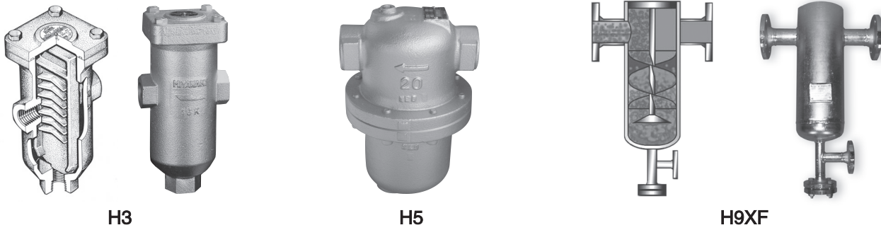
外形尺寸/规格一览